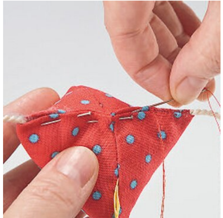
Beine mit einnähen