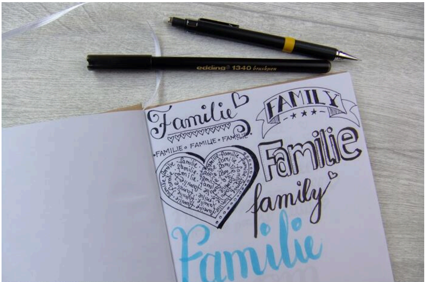
Hand Lettering - Schreibübungen Familie