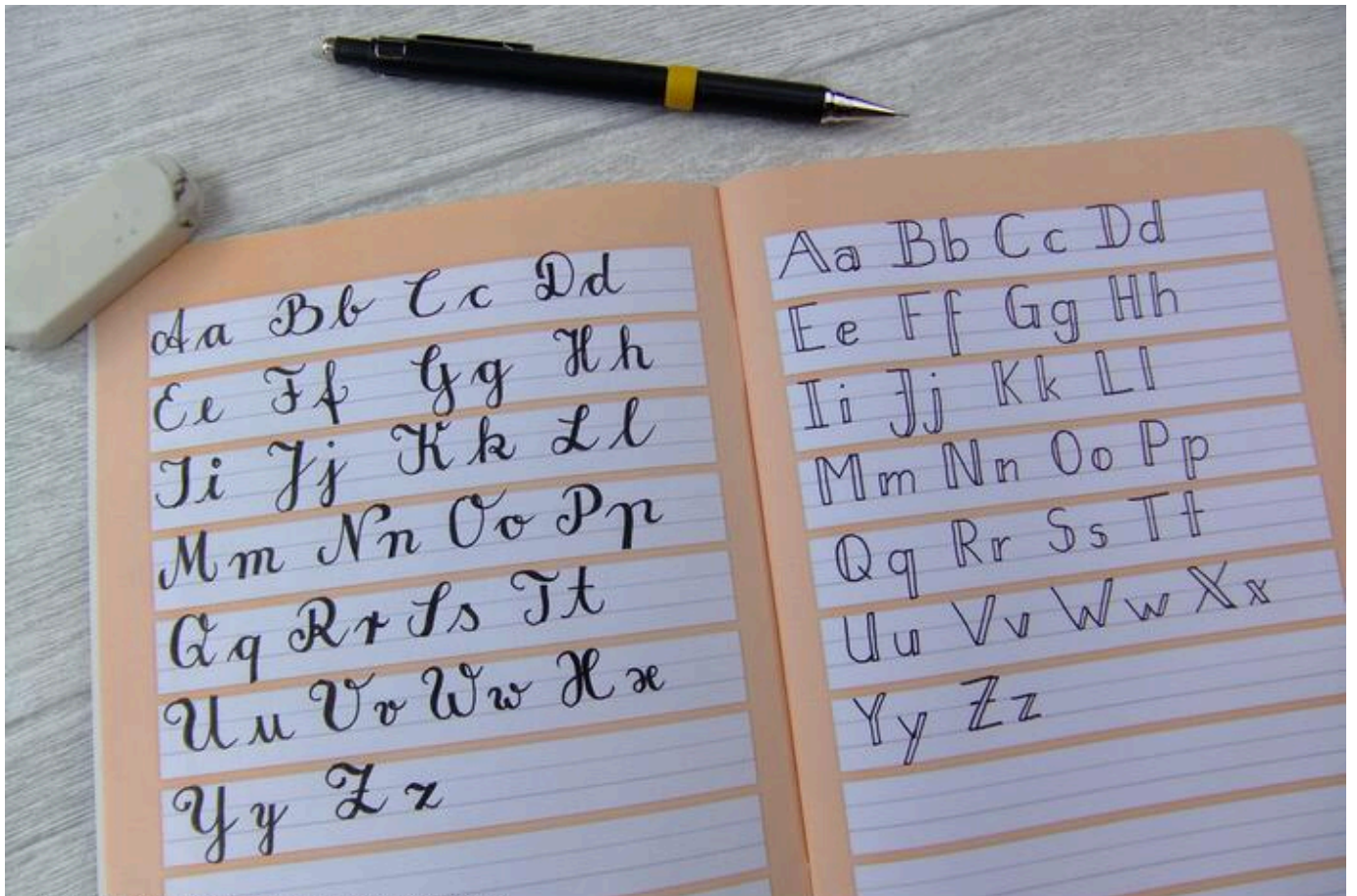
Hand Lettering - Schreibübungen Buchstaben

Eine Methode zum Sammeln von Schriftarten und Designideen ist das Notieren verschiedener Gestaltungen eines Wortes in deinem Notizbuch. Experimentiere mit verschiedenen Stiften. Bedenke: Übung macht den Meister!