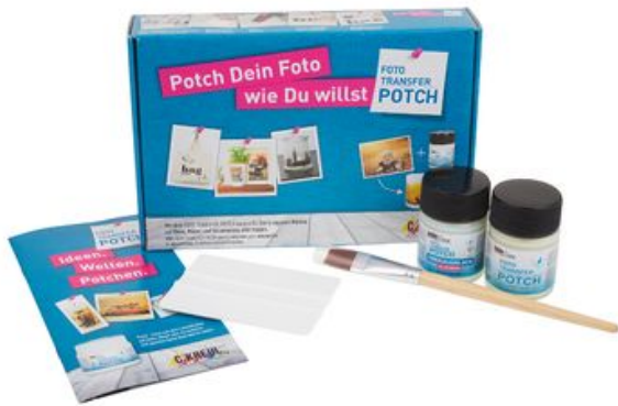
Foto Transfer Potch Set