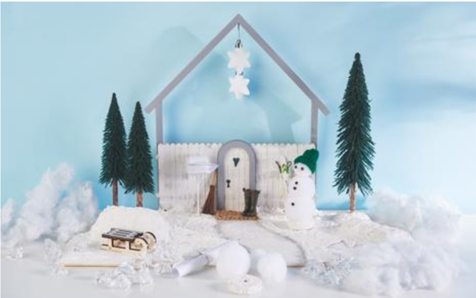
Tomte fait un bonhomme de neige