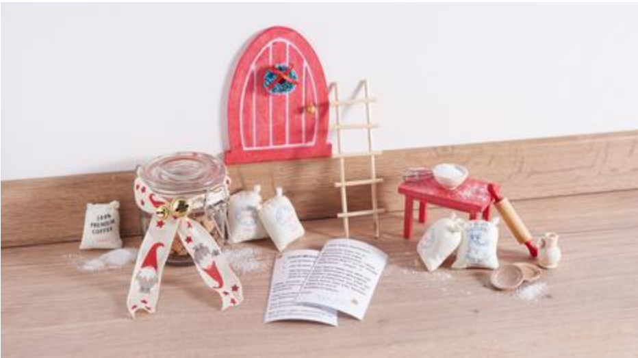
Tomte fait des biscuits