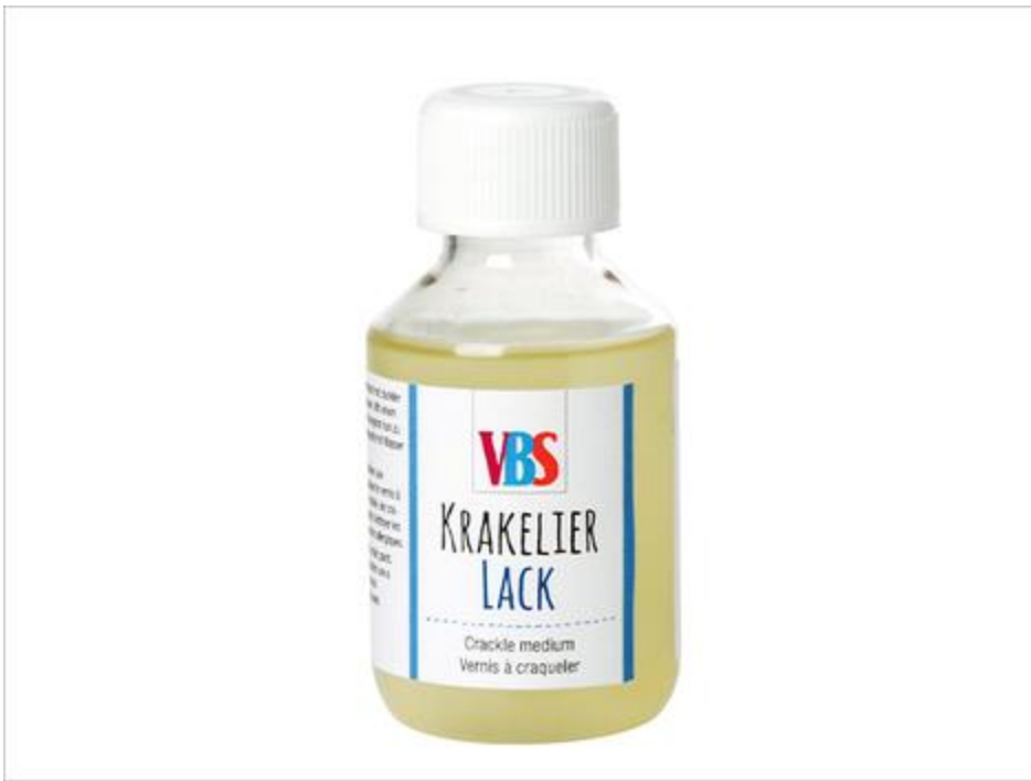
Vernis à craqueler