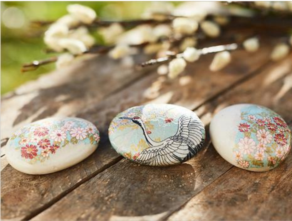
Exemple de décoration