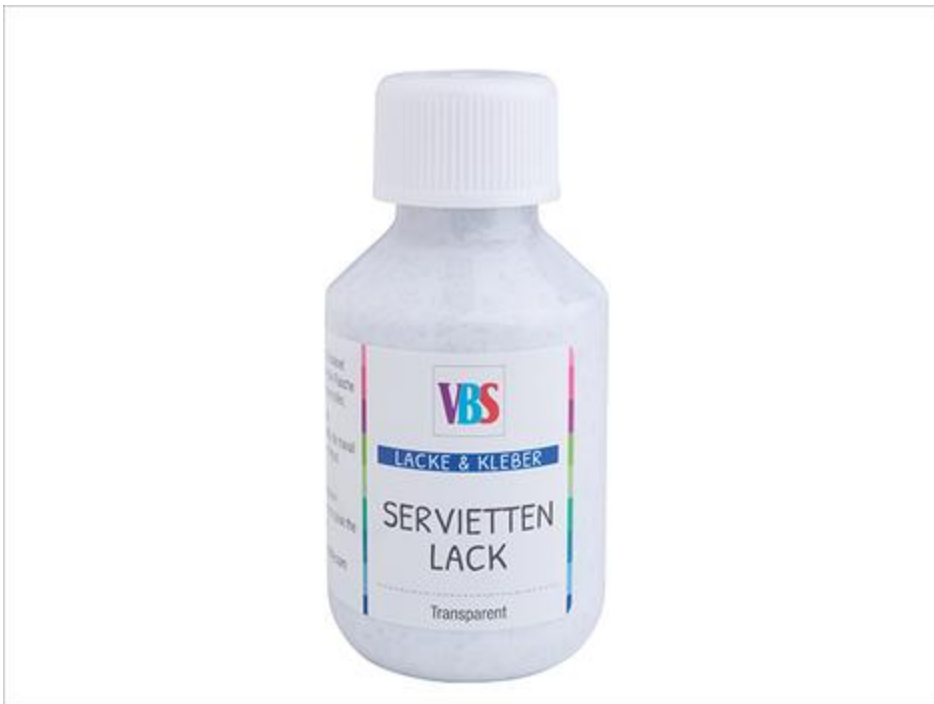
Colle-vernis à paillettes pour serviette

Essayez la technique sur d'autres surfaces :