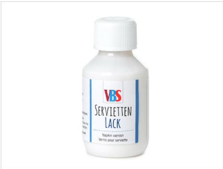
Colle-vernis pour serviette brillant