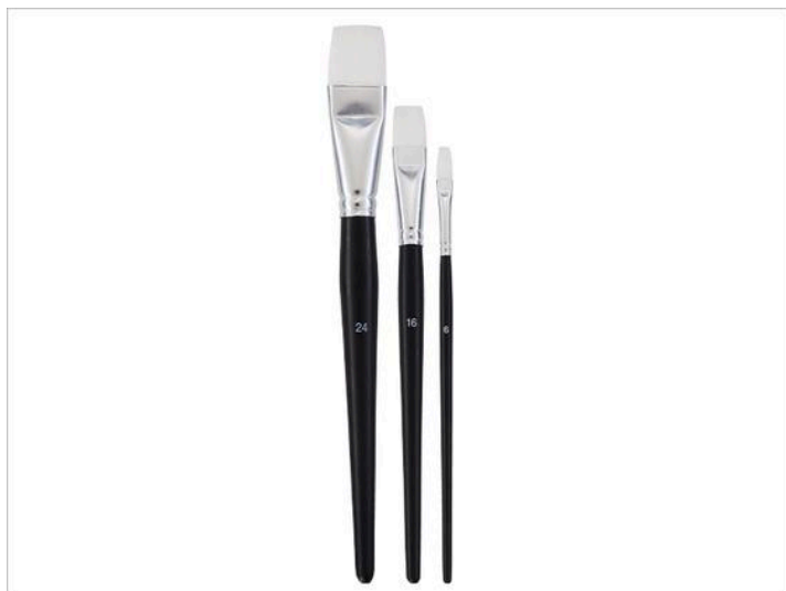
Pinceau pour serviette

Pour cette technique créative, vous avez besoin, en plus de l'objet à décorer , d'une serviette en papier avec un motif de votre choix, d'une paire de ciseaux pincettes , d'un pinceau pour serviette , ainsi que de la colle-vernis pour serviettes .