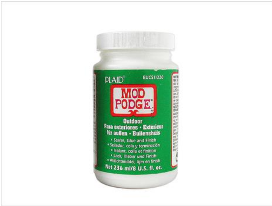
Colle serviette Outdoor