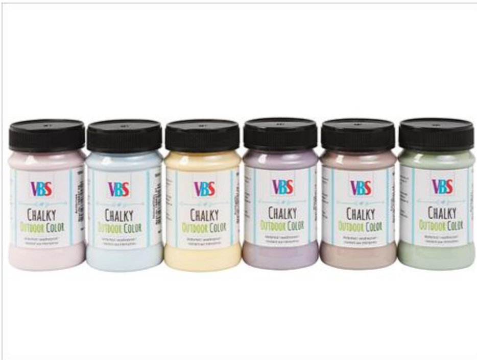
Peintures pour l'extérieur