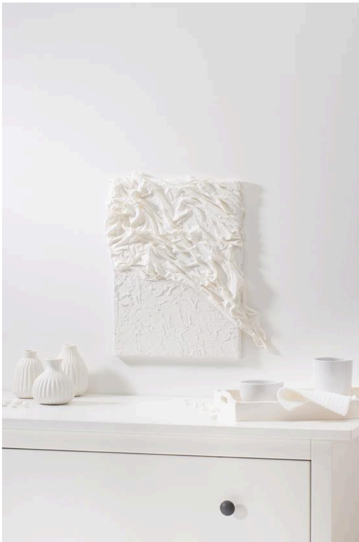
Image en relief en tissu modelé

Pour cette image structurée, tu as besoin d'un foulard en soie de 55 x 55 cm. Enduis généreusement le foulard de tissu rigide. Pose-le immédiatement en plis artistiques sur le site châssis entoilé, pour créer un effet 3D captivant. Laisse sécher pendant environ 6 x 8 heures.