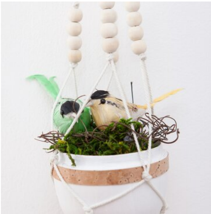
Macramé, quand tu nous tiens...