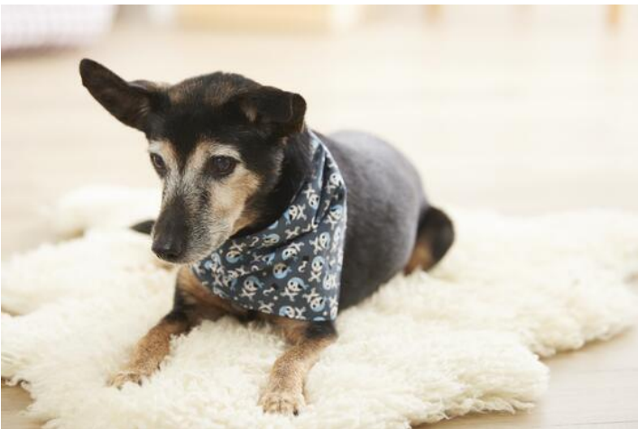
Foulard pour chien