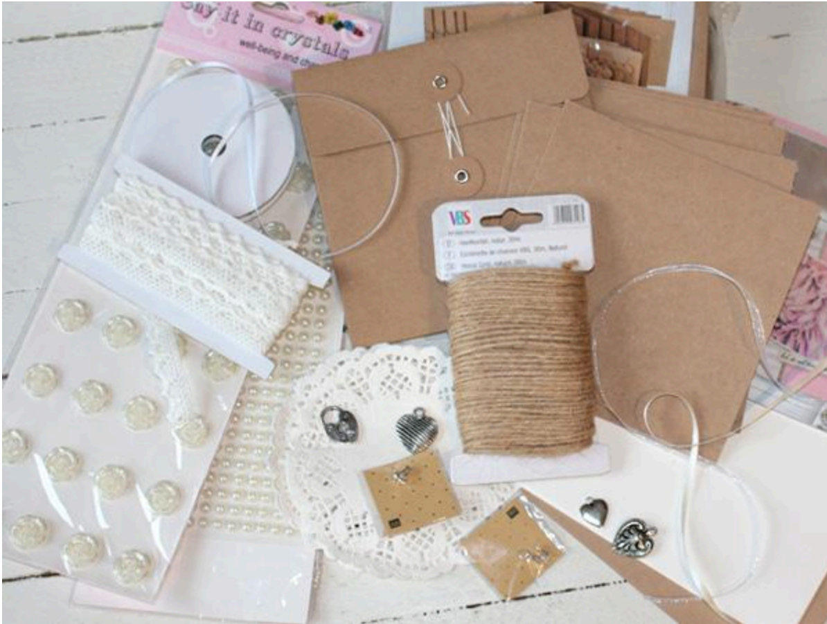
Schritt 1: Kreative