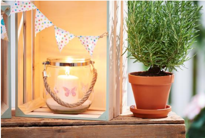
Windlicht mit Transfermotiv

Positioniere diese auf dem Windlicht und klebe sie mit Serviettenlack auf. Trage dabei so wenig wie möglich den Lack über das Motiv hinaus auf dem Glas auf. Überschüssigen Lack kannst du mit einem Bambusspieß wegkratzen oder mit Universalreiniger vorsichtig entfernen.